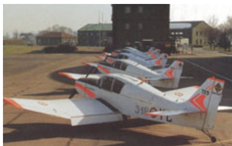
L'Escadrille des D140 E de la Base Adrien 101 de Toulouse-Francazal en 1993

Aujourd'hui, sous la plume de Xavier Massé, tout ce pan de notre histoire aéronautique revit grâce aux Dossiers Aéronautiques, publiés aux Nouvelles Éditions Latines. Chaque livre (5 à ce jour) décrit avec précision et exhaustivité les différentes réalisations de constructeurs dont le point commun est d'avoir souvent commencé au fond d'un garage. On est bien loin ici des bureaux d'études des grandes firmes et, pourtant, leurs noms sont toujours présents sur les aérodromes européens.